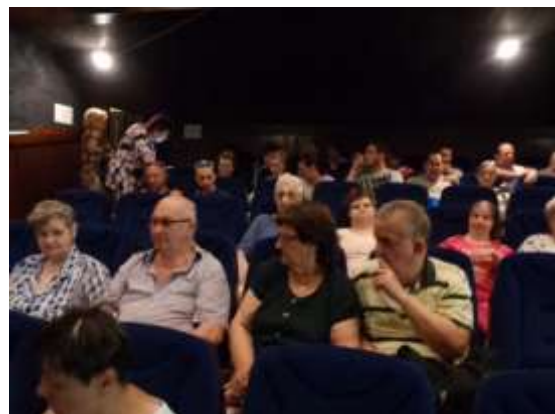
Június 24-én a „A Mia és a fehér oroszlán” című filmet láttuk, nagyon tetszett mindenkinek.