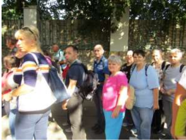
2019. 09. 16. A 28. SGYN Budapest, tagjaink egy csoportja.