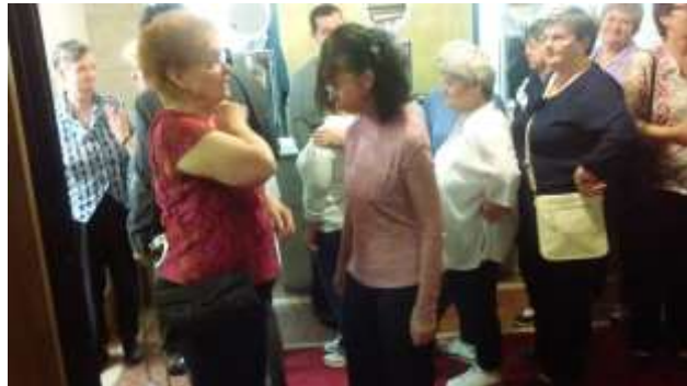
A „Hello Dolly” c. színdarabot néztük meg a Miskolci Nemzeti Színházban 2019. 05. 24-én. Tagjaink a színház előterében gyülekeznek.