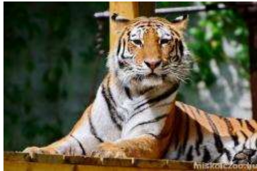
Egyesületi kirándulás a Csanyik völgyben (2019. 06. 01.), tagjaink egy csoportja pihen és élvezi a tájat, a friss levegőt. A csanyiki Állat- és Kultúrpark egyik gyönyörű tigrise, a büszke KIRÁLY”.