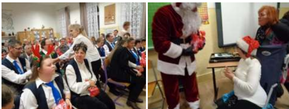
A Mikulás osztja a „Mikulás csomagokat”, csokoládét és szaloncukrot.

2019. 12. 13-án tartottuk Mikulás-Karácsony ünnepségünket. 2019. 12. 14-én Miskolc belvárosában Adventi Sétán vettünk részt, amelyet egy éttermi ebéd követett az ÉFOÉSZ támogatás jóvoltából. A Mikulás-Karácsony ünnepségen minden jelen lévő tagunk megkapta „Az én világom” című kiadványunk egy példányát a Mikulás csomag, a Milka csokoládé és a szaloncukor mellett. Nagy volt az öröm.