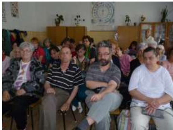
Egyesületi közgyűlés : vezetőségi beszámoló és a tagság. (2019. 05. 18.)