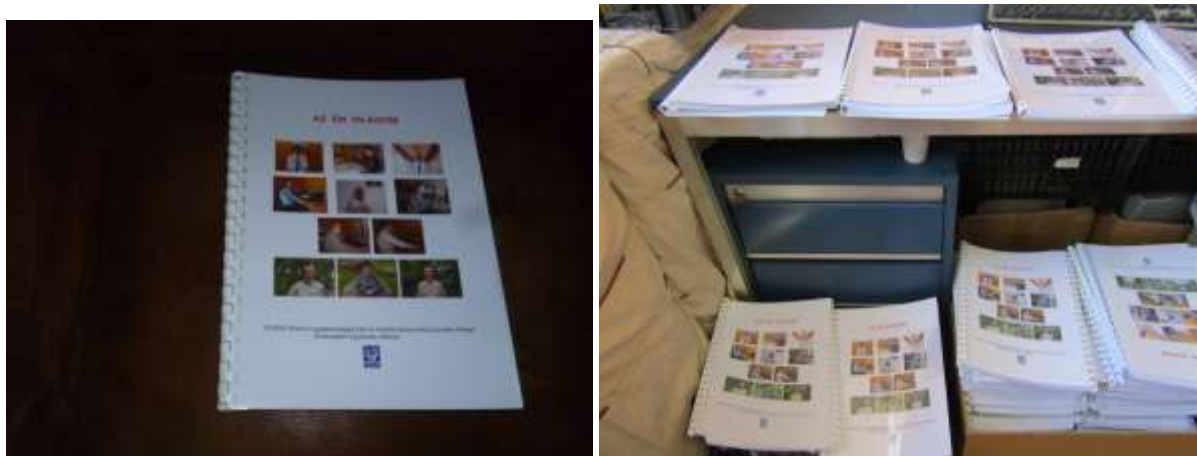
A Fesztiválon került ünnepélyes átadásra „ Az én világom ” című kiadványunk, amely az irodalmi pályázatunkon részt vevő tagjaink műveit (versek, történetek, stb.) tartalmazza. A szereplők és a művek szerzői is ajándékcsomagot és oklevelet kaptak.

December 3-án a Fogyatékos Emberek Világnapján a Miskolci Fogyatékosügyi Szakmai Műhely – amelynek egyesületünk is tagja - egy speciális eseménnyel emlékezett a világnapra. A Szakmai Műhely tagjainak bemutatkozása történt meg a Városházán, amelyre a Miskolc Megyei Jogú Város Közgyűlésének tagjai is meghívást kaptak. A bemutatkozó program végén egy szakmai politikai javaslatot adott át a Műhely koordinátora a Városháza képviselőinek, amelyben felhívtuk a döntéshozók figyelmét a fogyatékos emberek problémáira és a megoldás szükségességére.