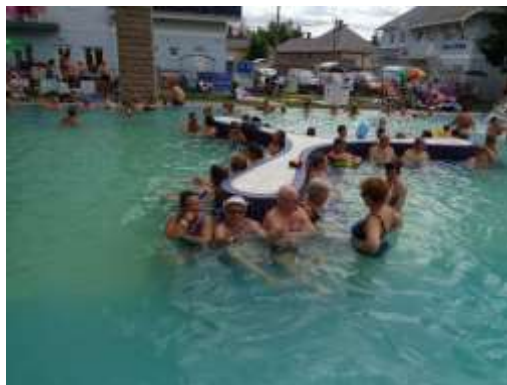
2019. 07. 24. Bogácsi Gyógy- és Strandfürdő-i kirándulásunk. 1/ Indulás Bogácsra a bérelt autóbuszokkal 2./ A fürdő kellemesen meleg vizében