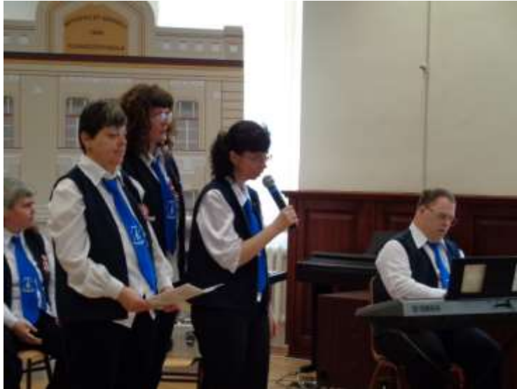
Paramuzsikusaink nagyszerű szereplése 2019. március 14-én a miskolci CSEÖH Esélynapján.