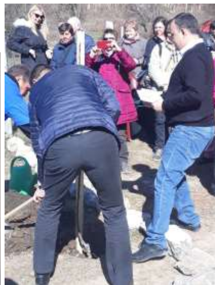
A miskolci Szimbiózis Alapítvány sikeres projektje (a „Fűzes Ház”, amely 12 fő fogyatékos személy számára ad otthont) március 20-i átadásán is jelen voltak tagjaink. (Miskolc, Baráthegyalja )