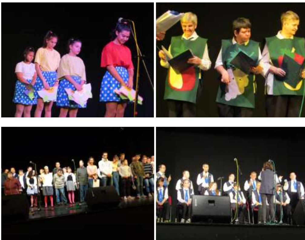
2019. 11. 22-én volt a Megyei Kulturális Fesztiválunk Miskolcon az Ady Endre Kulturális Központban, közel 70 fő szereplővel. Nagy siker volt.