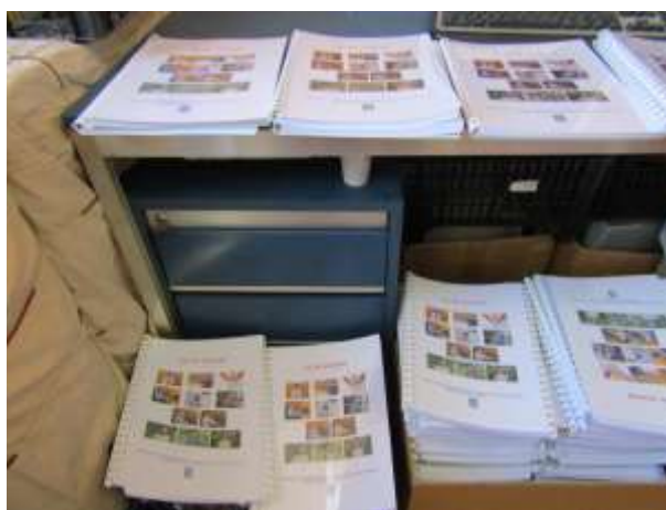
Elkészült egyesületünk „ AZ ÉN VILÁGOM ” című újabb kiadványa (2019)