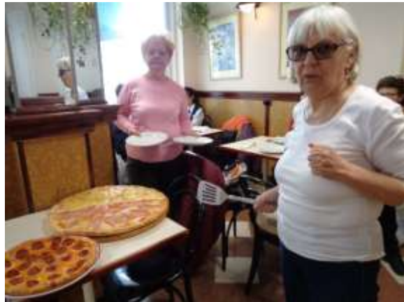
Miskolcon a Petőfi szobornál önérvényesítő csoportunk megemlékezett az 1848-as forradalomról. Az ünnepség után egy étteremben beszélgettünk, pizzát és üdítőt fogyasztottunk az ÉFOÉSZ támogatásának köszönhetően.