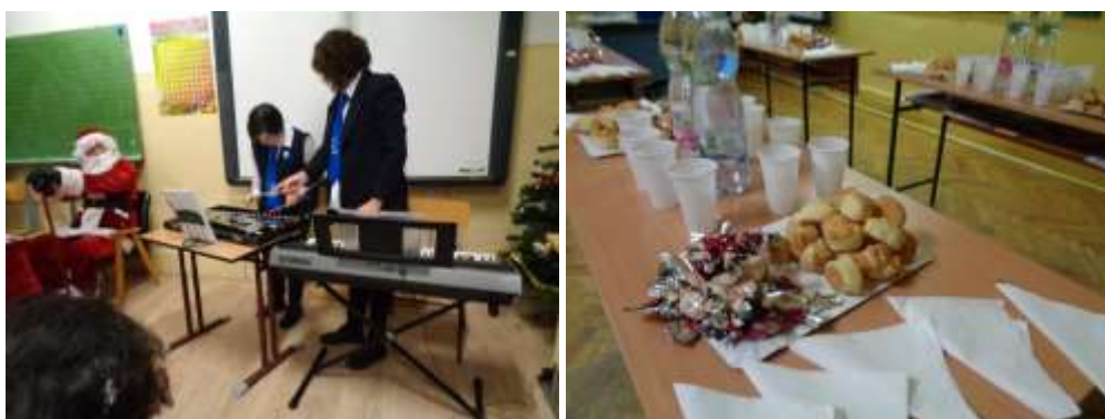
Az ünnepségen szép műsort is adtak tagjaink, amelyet egy „megvendégelés” követett.