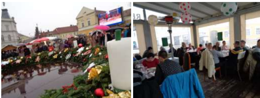
Az Adventi Sétánk résztvevői az Adventi Koszorú mellett és az étteremben