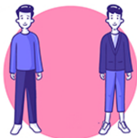
Tarts 1,5 méter távolságot