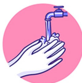
Moss gyakran kezet