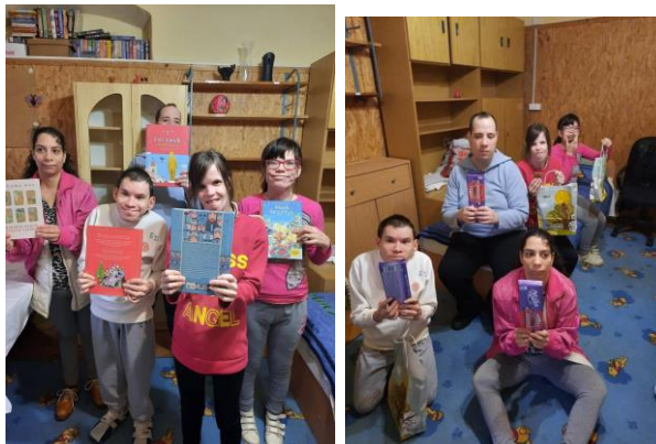
A nagyszerű YouTube-os műsort adó AZISZI Boldogkőváraljai Otthona lakói az ajándékokkal