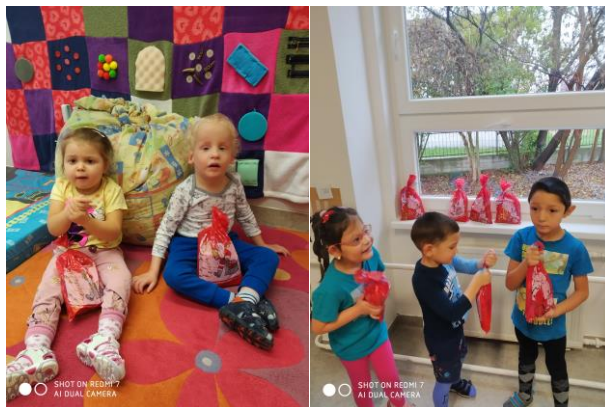
A miskolci Tüskevár óvoda aranyos kis ovisai örülnek a Mikulás csomagoknak.