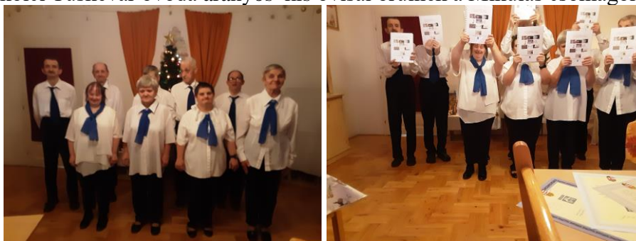
A Dél-Borsodi Integrált Szoc. Intézmény Görömbölyi Támogat-lak lakóinak is kiváló műsora volt.