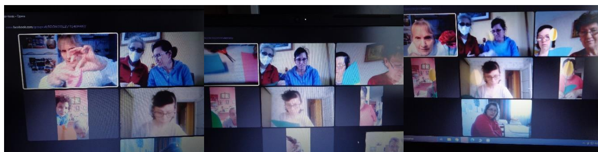
2021.04.23. Önérvényesítő, kézműves foglalkozás- online, Messenger