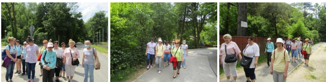
2021.06.11. Kirándulás Miskolc –Lillafüreden