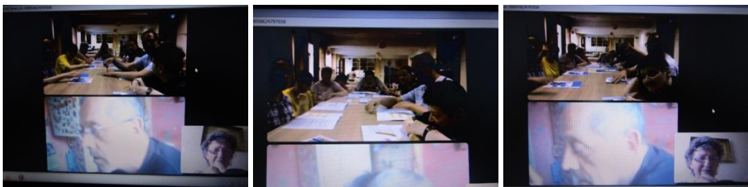
2021.06.17. 8.Workshop online- Messenger, Témája: „Értelek és megértelek”