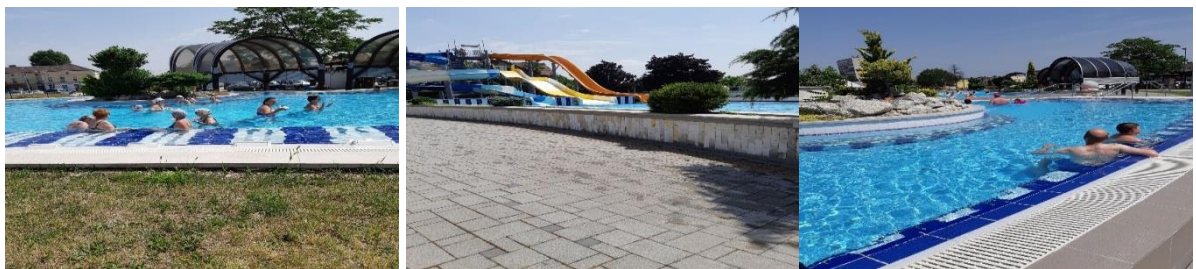
2021.06.22. Kirándulás a Miskolc Selyemréti Strandfürdőbe