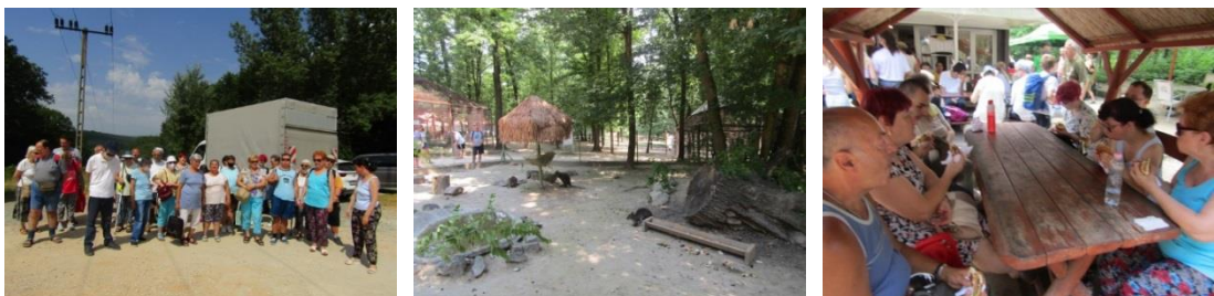
2021.06.30. Kirándulás – Miskolci Állatkert