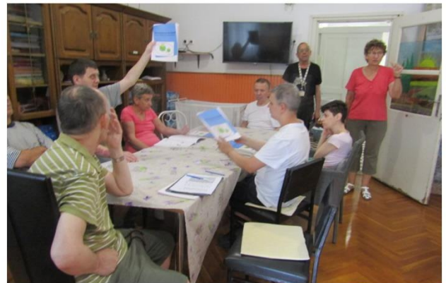
2023.06.09. Szakmai együttműködés 3529 Miskolc, Szilvás u. 39. MÁON