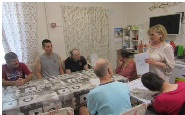
2023.06.26. 9. Workshop Téma: „Koronavírus és Covid. Amit a világjárványról tudnod kell!” 3532 Miskolc, Rác Ádám u. 35. Csilla Báronő Szeretetotthon 1. csoport