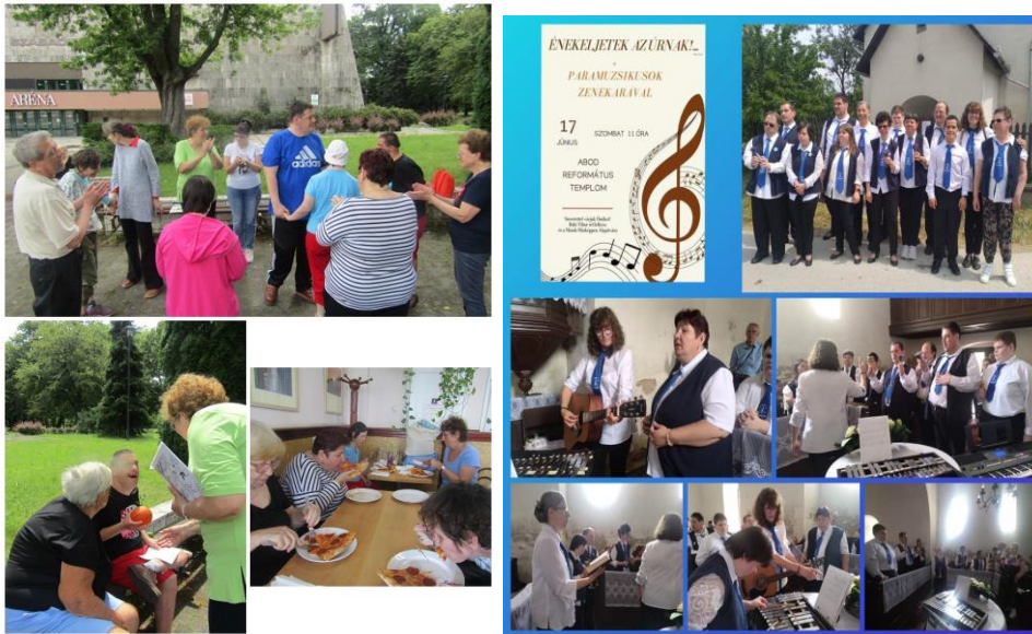
Népkertben önérvényesítő foglalkozás (2023.06.10)