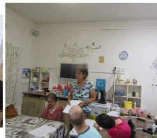
2023.06. 28. Szakmai együttműködés 3532 Miskolc, Rác Ádám u. 35. Csilla Báronő Szeretetotthon 2. csoport