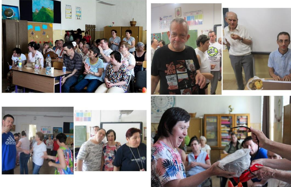
gyermeknap i ünnepség (2023.06.02)